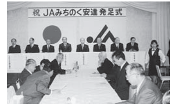
JAみちのく安達 発足式

3月1日／二本松市農協、安達町農協、岩代町農協、福島東和農協が合併して設立 4月20日／女性部設立総会（管内女性部の一本化） 5月22日／総代選挙（530名の新たな総代選出） 7月3日／JA組織討議（JA21戦略第3期3か年運動の実践に向け意見集約） 10月4日／道の駅安達給油所オープン