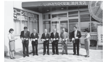
油井総合支店統合新装オープン

4月18日／第1回通常総代会 7月1日／油井総合支店統合新装オープン（油井支店が油井総合支店へ統合され新装店舗に） 9月4日／JA役職員緊急防除作業（8月末の集中豪雨で冠水被害を受けた水田に殺菌剤散布） 9月24日／安達ライスセンター竣工