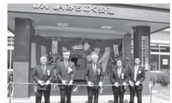
居宅介護支援事業所営業開始

3月14日／第2次支店統廃合 3月16日／統合支店営業開始、移動金融店舗車「みちのくふれあい2号」 営業開始 5月1日／居宅介護支援事業所（二本松事務所）営業開始 5月30日／第12回通常総代会 10月29日／組合員のつどい（山本譲二ショー） 11月27日／第37回JA福島大会