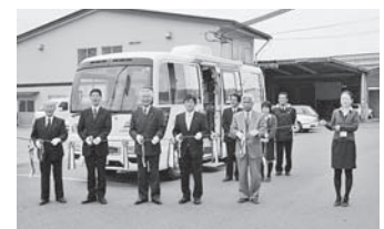
移動金融店舗車 「みちのくふれあい号」出発式

3月8日／第1次支店統廃合 3月10日／統合支店営業開始、初移動金融店舗車営業開始 5月24日／第11回通常総代会 10月28日／組合員のつどい（水森かおりショー） 12月15日／「元気な茶の間」しらさわオープン 12月17日／「元気な茶の間」あだちオープン