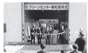
グリーンセンター東和オープン

1月26日／グリーンセンター東和オープン 4月3日／小浜直売所オープン 5月13日／東和総合支店改装オープン 5月25日／第5回通常総代会 6月21日／グリーンセンター岩代オープン 10月25日／安達郡開拓農協合併予備調印式 11月26日／臨時総代会（安達郡開拓農協との合併）