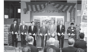
グリーンセンター白沢オープン

1月24日／臨時総代会 4月28日／養豚部統一総会 4月29日／グリーンセンター白沢オープン 5月28日／第8回通常総代会 9月10日／合併1周年記念組合員のつどい（小林幸子ショー）