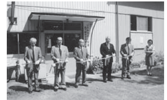
岳下総合支店岳山麓出張所開所式

3月13日／やさい振興大会（東和町文化センターに600名が参加） 4月17日／第2回通常総代会 5月31日／岳山麓酪農協合併予備調印式 6月25日／臨時総代会（岳山麓酪農協合併承認） 9月1日／岳下総合支店岳山麓出張所開所式 10月23日／JAみちのく安達シンボルマーク決定