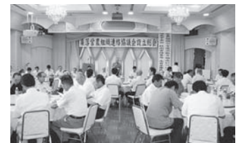
集落営農組織連絡協議会設立総会

5月26日／第10回通常総代会 8月23日／集落営農組合連絡協議会設立総会 9月20日／「農協法公布60周年によせる提言・作文」審議会 10月30日／組合員のつどい（長山洋子ショー）