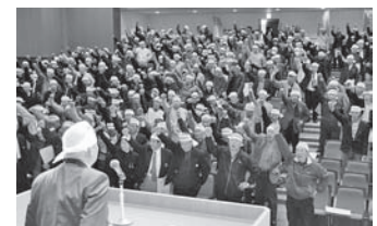
安達地域緊急決起集会 （TPP反対運動）

5月29日／第13回通常総代会 10月27日／組合員のつどい（キム・ヨンジャショー） 11月6日／水田農業危機突破決起集会（TPP反対運動） 12月4日／安達地域緊急決起集会（TPP反対運動）