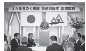
JAみちのく安達合併10周年式典

5月27日／第9回通常総代会 10月14日／玉井支店購買店舗オープン 10月25日／組合員のつどい（香西かおりショー） 11月1日／JA斎場あだちオープン 11月17日／第35回JA福島大会 12月7日／JAみちのく安達合併10周年式典