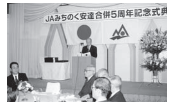
合併5周年記念式典

5月27日／第4回通常総代会 9月26日／グリーンセンター油井オープン 11月20日／合併5周年記念式典