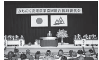
臨時総代会、新役員選任

3月30日／安達畜産農業協同組合との事務移管に関する覚書締結 4月24日／みちのく安達農協、本宮農協、大玉村玉井農協が合併予備契約書締結 5月29日／第7回通常総代会 9月1日／新生みちのく安達発足（安達郡3JA合併） 9月25日／臨時総代会 10月2日／JA女性部、青年連盟合併