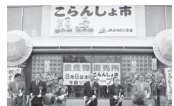
「こらんしょ市」オープン

2月1日／安達郡開拓農協と合併・岳山麓出張所移転開所 3月19日／臨時総代会（斎場建設予定地取得） 3月26日／福島県農業者政治連盟みちのく安達支部設立総会 5月24日／第6回通常総代会 6月4日／JAみちのく安達燃料株式会社設立（燃料部門分社） 6月10日／JA共同施設株式会社設立（葬祭部門分社） 7月1日／JAみちのく安達燃料株式会社業務開始 8月8日／ファーマーズマーケット「こらんしょ市」オープン 11月7日／第1回安達地方JA合併推進協議会 12月12日／JA斎場「あだたら」オープン